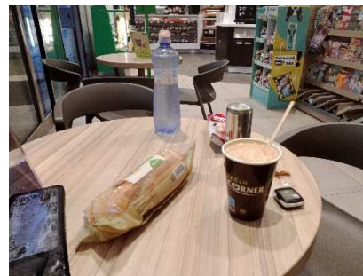
Pořádná snídaně – základ dne

Pondělí. Po dvou a půl hodinách spánku a půlhodině klepání kosa v lehkém spacáku si musím udělat malou rozcvičku abych se zahřál a přestal se třást jak při epileptickém záchvatu, jinak bych se stěží spakoval. Za chvíli jsem v Kladské, a pak tradá z kopce do Mariánských lázní rovnou na benzínku na snídani. Poznámka: benzínky by se měly jmenovat „čerpací stanice – občerstvovny šílených cyklistů“.