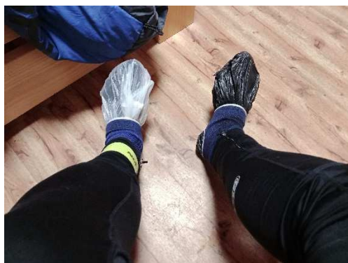
Důkladná protidešťová úprava (vydržela cca půl hodiny)

Úterý. Budí mě jakési šramocení. V chatce panuje naprostá tma. Někdo vstává a za svitu mobilu se balí. Myslím si, že je ještě noc, ale ono už je 5 ráno. Vstáváme tedy všichni. Jak zjišťujeme, venku