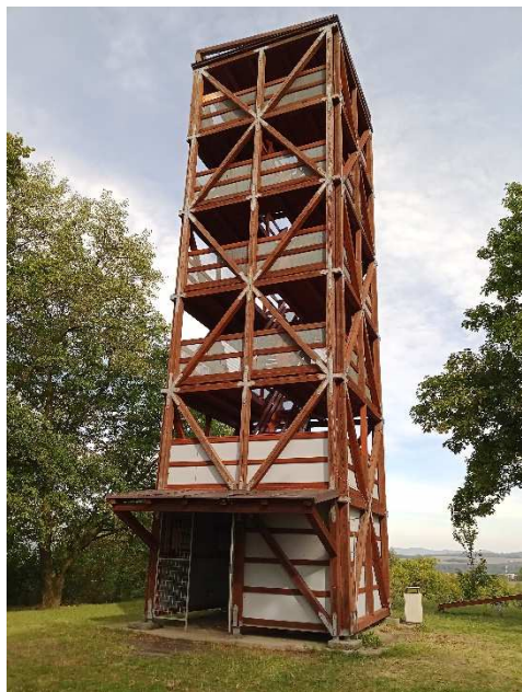
Nad Horšovským Týněm