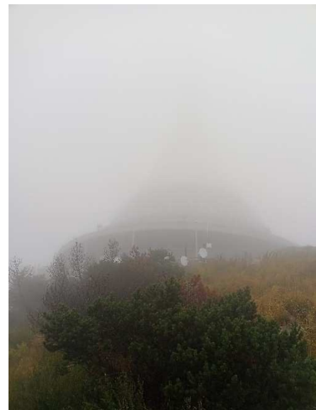
Všude dobře... na Ještědu ne!

Pak se přede mnou vypíná kuželovitá hora Ralsko. Ještě že k vrcholu nemusím. Trápí mě ale něco jiného. Rychle se blíží večer, mám hlad a přede mnou velké deště. V bufetu u cesty zhltnu mísu zelnačky, zaliju birelem a jedu dál na západ. Před Českou Lípou cítím první kapky. Město projíždím skoro za tmy. Za Lípou zase trochu prší a trochu neprší. České středohoří mě vítá dlouhým stoupáním a síly rychle ubývají. Tma, samota... už se spíš ploužím. Pořád a pořád do kopce. Cestou se rozhlížím, kde bych hlavu složil. Ve vesničce Rychnov mě dojíždí jeden závodník, dlouho ale nepoklábosíme. Zůstávám na zastávce a jsem rozhodnutý tu ulehnout, protože po dnešních 199 km