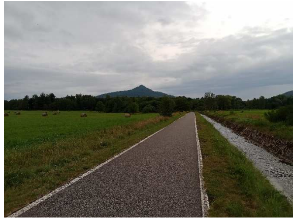
Další fotky do cíle nemám – tak tady ještě jedu z cesty okolo Ralska