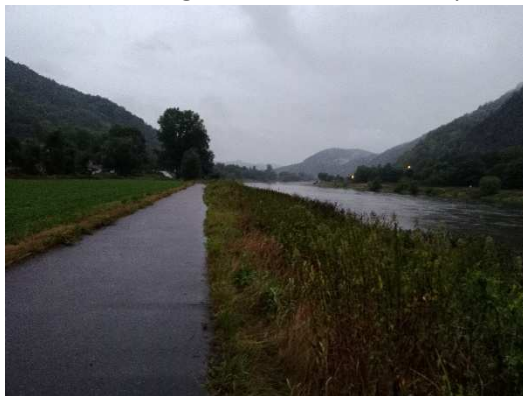
deštivým ránem Labskou cyklostezkou

Neděle. Vstávám před pátou, venku je tma a leje jak z konve. Nebýt toho, že jsem se s panem vedoucím domluvil na odchod v 5, asi bych se nevykopal. Vůbec se mi do toho nechce. Alespoň že teď jedu pěkně z kopce. No jo, jenomže úplně blbým směrem. Na ceduli vidím Příbram. Tak to jsem skoro doma, říkám si. Jenže tohle není ta naše – a už vůbec jsem tu neměl být. Asi jsem se měl víc koukat do navigace, takže zase 2 km zpět do kopce a pak už správně. Sjíždím pěkných 6 km skrze lesy